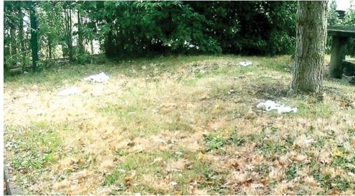
Ein trauriger Anblick - Haufen an Haufen auf dem Kinderspielplatz im Scheurenbohl.