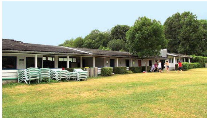
In die Jahre gekommen ist der Umkleide- und Sanitärtrakt im Erlebnisbad Engen. Deshalb wird der Eingangsbereich in erweiterter Form neu gebaut.