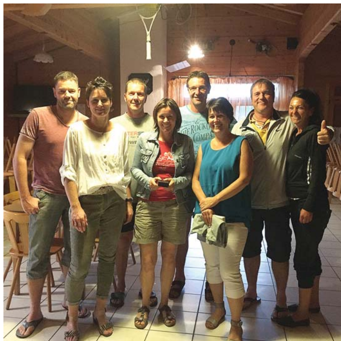
Die Siegerinnen und Sieger des Mixed-Wettbewerbs.