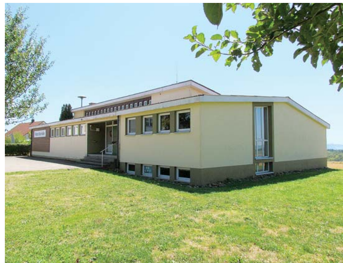
Sie soll nicht nur wie bisher als Sporthalle nutzbar sein, die Petersfelshalle in Bittelbrunn, sondern in Zukunft in Form eines Bürgerhauses allen Bittelbrunnern zur Verfügung stehen.

gramm Ländlicher Raum (ELR) zu erhalten, sei zudem ein Austausch des Heizsystems erforderlich, erläuterte Distler. Gefordert werde eine Heizung mit alternativen Brennstoffen. Um für das kommende Jahr ELR-Mittel zu beantragen, müsse spätestens im September eine Planung mit Kostenberechnung vorliegen und gegebenenfalls im Oktober der Bauantrag gestellt werden.