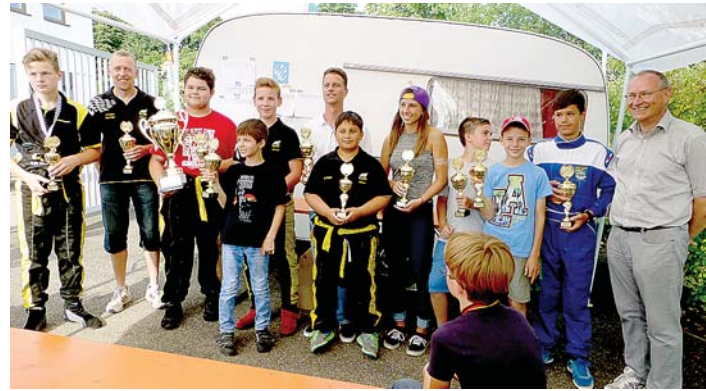
Gruppenfoto der platzierten Teilnehmer nach der Siegerehrung, gemeinsam mit den Sportwarten Rainer Ergler und Peter Breuer.